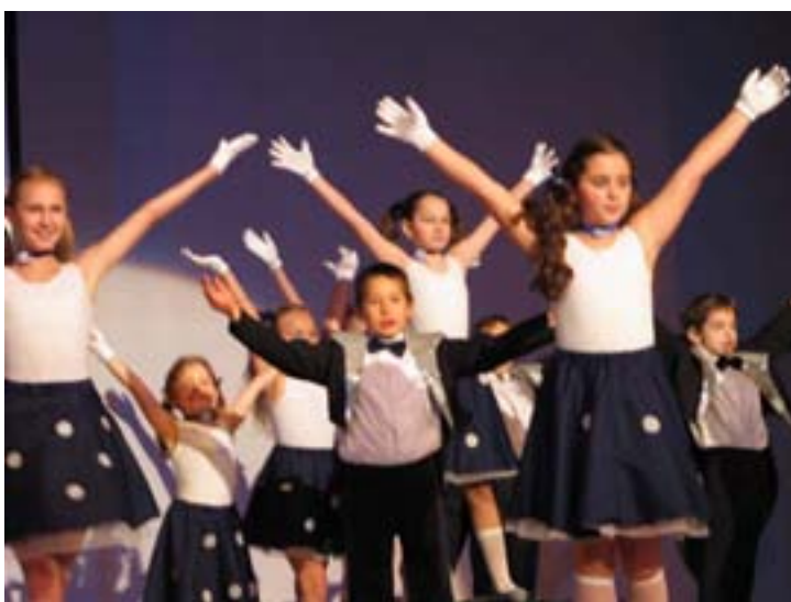
Najmłodszy uczestnicy I OFPR , zespół Apli-papli z Domu Kultury w Trzebini.